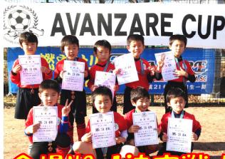
AVANZARE CUP 会場NO.1決定戦！

2014年、新年一発目に、皆様への日頃の感謝の気持ちをこめ、「大感謝祭」と称し、クラブ会員全員参加型の『特別ミニアバンツァーレカップ』を開催します！内容は、各会場で行われているスクール練習時にミニアバンカップを開き、子ども達も親御さんも楽しんでもらっちゃおう！というものです。皆さんが喜べるような内容を現在準備しています。いよいよ1月イベントスタート！皆さん、休まずに練習に参加してくださいね！みんなで思い切りサッカーを楽しんじゃおう！