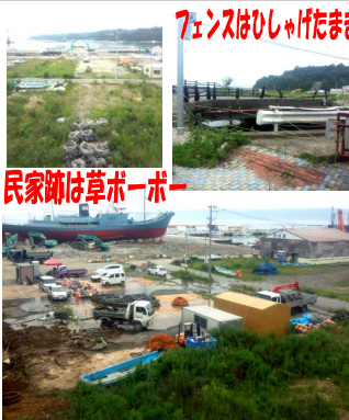
7エンスはひしゃげたまま 民家跡は草ボーボー