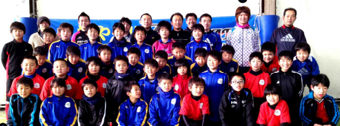
初蹴り親子対決「高学年の部」