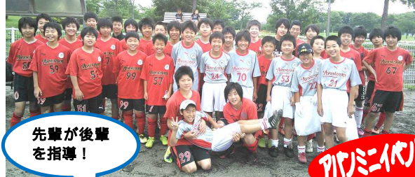
先輩が後輩を指導!