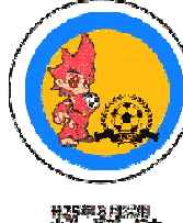
H25年8月採用 山形 丸野 龍大