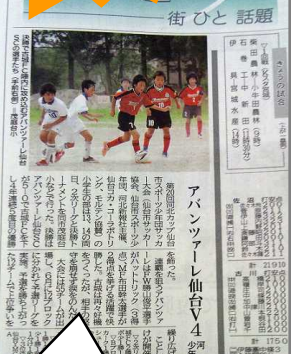
河北新報 7月15日 みやぎスポーツ欄