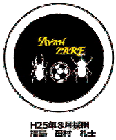
H25年8月採用 福岡 田村 礼士