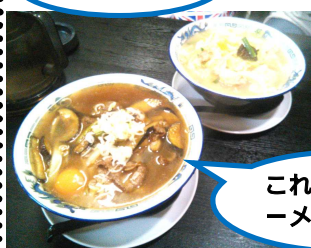
これが「東龍ラーメン」

中華麺房 東龍 名取店 名取市上余田千刈田 251-4 11:00~15:00 18:00~22:00 第1、第2火曜日が定休日