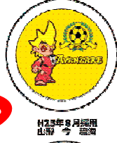
H25年8月採用 山形 今 瑞海