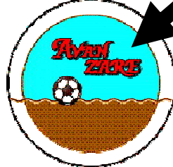
H25年8月採用 仙台 松内 登真