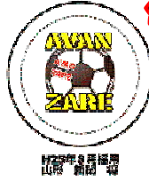
H25年8月採用 山形 新田 瑞