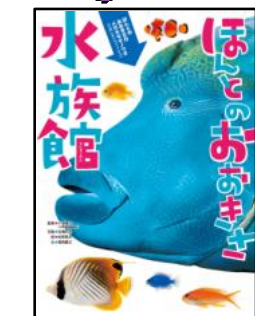
小宮輝之 著・監修 1,575円

『ほんのおおきさ水族館』色とりどりの魚たちや、イルカやラッコなど、水族館ならではの生き物の顔やからだを、全て実物大の写真で紹介します。ふつうの図鑑とはひとあじ違い、大人も子供も楽しめる、驚きと感動にあふれた本です。また、『ほんのおおきさ動物園』『ほんの大きさ恐竜博』など、このシリーズ多数発刊されています。すべてお薦めです!