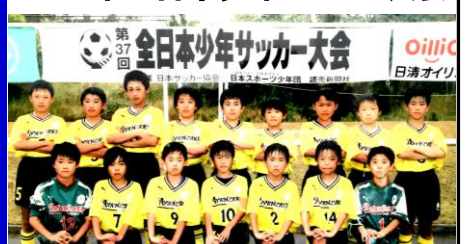
山形県大会ベスト16集合写真