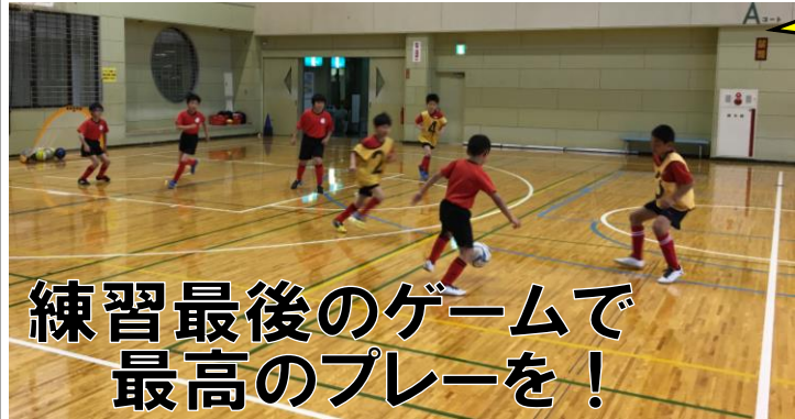
練習最後のゲームで最高のプレーを!

実施していた「お友達ご紹介キャンペーン」が大変人気のため7月末までの2ヶ月間延長開催することが決まりました! 皆様のお友達や、知り合い、ご兄弟でサッカーに興味がある、サッカーを習いたいという方がいらしたら、ぜひアバンツアーレをご紹介ください! みんなでサッカーの輪、スポーツの輪を広げていきましょう!