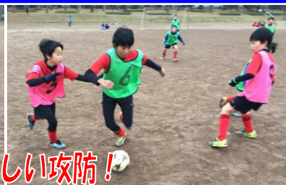
球際の激しい攻防!