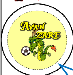
H26年7月採用 仙台 松内 寛真