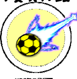
H26年7月採用 山形 村上 英士